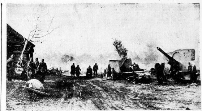
Durchstoß: Ein deutscher Stoßtrupp steht bereit, um die bolschewistischen Widerstandsnester, die durch das Feuer der Deutschen Geschütze sturmfällig geschossen werden, anzugreifen.