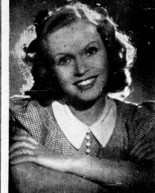
„Ratraz Richter“ — einmal anders

Die Gedenktafel an der Villa in Brünn, die an den Aufenthalt des Freiherrn vom Stein im Jahre 1810 erinnert, wurde am 25. Oktober 1941 enthüllt. Die Gedenktafel an der Villa in Brünn, die an den Aufenthalt des Freiherrn vom Stein im Jahre 1810 erinnert, wurde am 25. Oktober 1941 enthüllt.