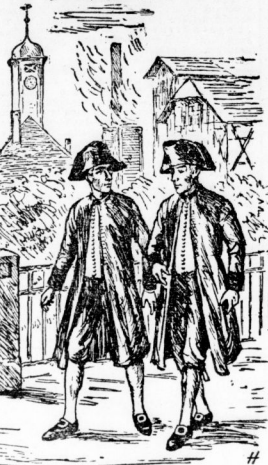
Zeichnung: Gerhart Heß

Ballonen Wer hat, solange die Sole rinnt In Halle an der Saale, Daran von Kind zu Kindeskind Das Salz gemischt im Tale? Wer hat, mit Fisch darauf bedacht, Die Stadt einst groß und reich gemacht? Wer sonst als die Hallenser!