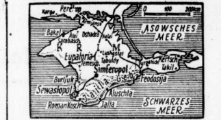
Zu den großen deutschen Eroberungen auf der Krim (Karte Scher)