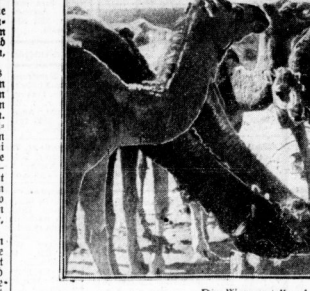
Die Wasserstelle als Treffpunkt der Wüste. Hier findet sich alles zusammen: der deutsche Soldat und der Halbesamer Kamerad, sowie der Araber.

Wir haben allein zwischen den niedrigen Häusern, die sich in einem Winkel auf dem Hügel befinden, ein einigermassen großes Gebäude: die Wolk. Am Rande sind noch weitere. Durch die Fenster sieht man in leere Straßen, in denen das Leben auf dem Stande steht. Die Wolk ist ein altes Gebäude, das aus einem altem Gebäude besteht. Die Wolk ist ein altes Gebäude, das aus einem altem Gebäude besteht. Die Wolk ist ein altes Gebäude, das aus einem altem Gebäude besteht.