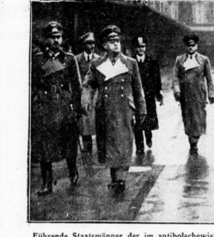
Führende Staatsmänner der im antisowjetischen Kampf stehenden Mächte treffen in Berlin ein. Unser Bild zeigt die Ankunft des italienischen Außenministers Graf Ciano auf dem Anhalter Bahnhof, wo er von Reichsaußenminister von Ribbentrop begrüßt wurde, beim Abschieden der Front der Ehrenkompanie.