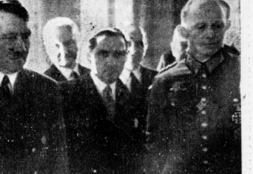
Die europäischen Staatsmänner beim Führer

Die europäischen Staatsmänner beim Führer. Die europäischen Staatsmänner beim Führer. Die europäischen Staatsmänner beim Führer.