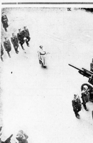
Die Jahrhunderte haben es verändert, es hat sich verändert, es ist nicht mehr, was es einmal war. Die Jahrhunderte haben es verändert, es hat sich verändert, es ist nicht mehr, was es einmal war.

Die Menschen nannten es „Vindawin“ oder „Vindawin“, das ist das englische Wort „window“. Das „Vindawin“ war nicht das Fenster, das wir heute kennen, sondern ein anderes. Die Jahrhunderte haben es verändert, es hat sich verändert, es ist nicht mehr, was es einmal war.