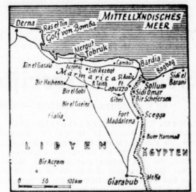
Kampfbild Nordafrika (Karte: Scherl-M.)