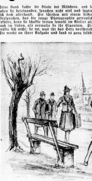
Ihn holte ein Mädchen ab, das ohne Scheu bei ihm unterlachte.