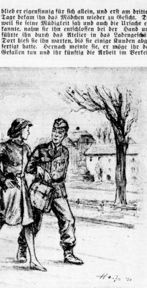
(Zeichnung G. Heiß)

verständlich, daß sie dem Geschehen ausführlich von allen Geschehnissen Mitteilung machte.