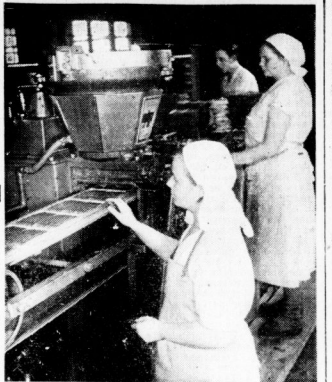
Arbeit an der Abtastanlage, wo die Schokoladenmasse in Metallformen gegossen wird

Tafelschokolade nach Wehrmarchtsrezept — Ein aufschlußreicher Rundgang durch eine hallische Schokoladenfabrik