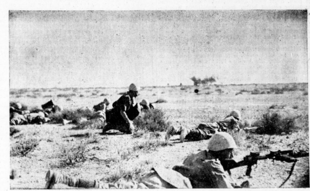
Der Krieg in der Wüste Italienische Infanterie bei einem Angriff gegen die englischen Stellungen an der Marmarica-Front. (Lucy, H.H.)