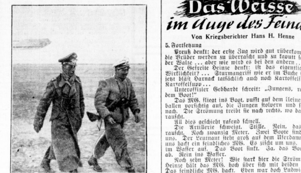
General Rommel ist mit seinem 'Storch' auf einem Flugplatz an der Front in Nordafrika eingetroffen...