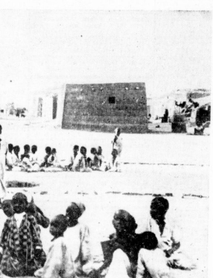
Eingeborene von Kharium im Sudan