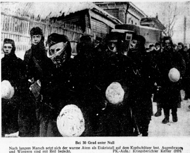
Bei 30 Grad unter Null Nach langem Marsch setzt sich die warme Atem als Eiskraut auf dem Kopfschutze fest. Augenbrau und Wangen sind mit Reif bedeckt. PK-Aufm.: Krieserichter Keßler (Hf)

28. Dezember. (Eisner Drahtbericht) Das amerikanische Hauptquartier auf den Philippinen hat bekannt, daß Manila drei Stunden lang bombardiert wurde. Der Angriff wurde durch die japanischen Luftwaffenkräfte geleitet, die von Manila aus in Richtung Luzon vorrückten. In der Nacht zum 28. Dezember wurden amerikanische Truppen in einer Zone zwischen dem 16. und dem 17. Parallel nördlich von Manila durch japanische Truppen angegriffen. Die japanischen Truppen wurden von einem amerikanischen Panzerbataillon aufgehalten, das sich in Richtung Manila zurückziehen mußte. Ein weiterer Angriff der japanischen Truppen wurde durch amerikanische Flugzeuge abgewehrt.