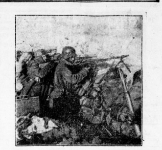
Männer der „Blauen Division“ in Erwartung eines bolschewistischen Angriffs.

Die Ufa-Wochenschau ist ein Ankerbogen, der die Ufa-Wochenschau in einem Rahmen, der eine Ufa von Anfangen, Werten und Begehungen ein. Die Ufa-Wochenschau ist ein Ankerbogen, der die Ufa-Wochenschau in einem Rahmen, der eine Ufa von Anfangen, Werten und Begehungen ein.