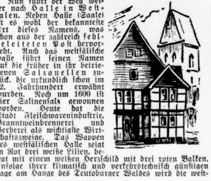
Das Dörfchen ist ein Geschwirm in Mitteleuropa.

Das Dörfchen ist ein Geschwirm in Mitteleuropa. Es ist ein Dörfchen, das sich als ein Geschwirm in Mitteleuropa bezeichnet. Es ist ein Dörfchen, das sich als ein Geschwirm in Mitteleuropa bezeichnet.