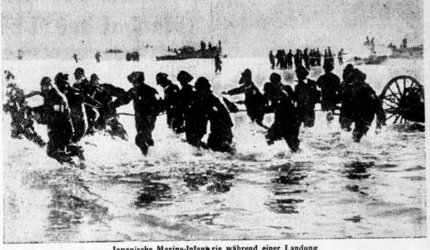
Japanische Marine-Infanterie während einer Landung. Truppen und Kriegsmaterial werden ausgeladen und durch das niedrige Wasser ans Ufer geschickt.

Während die westlichen U.S.A.-Truppenverbände auf den Philippinen der Vernichtung entgegengehen, stellt das britische Expeditionskorps sich dem Vorrücken der Japaner auf Malain gegenüber. Die britische Expeditionskorps besteht aus 200.000 Mann und ist in Singapur, Malain und auf den Philippinen stationiert. Die Japaner sind bereits Singapur stark bedrängt und drohen die britischen Rückzugslinien zu durchbrechen.