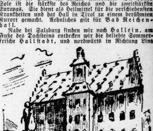
Das Dörfchen ist ein Geschwirm in Mitteleuropa.

Das Dörfchen ist ein Geschwirm in Mitteleuropa. Es ist ein Dörfchen, das sich als ein Geschwirm in Mitteleuropa bezeichnet. Es ist ein Dörfchen, das sich als ein Geschwirm in Mitteleuropa bezeichnet.