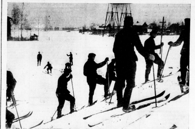
Unsere Soldaten lernen Schaulagen Ein kleiner Abhang in einer Ortschaft dient unserer Infanterie als Übungsgelände.

Man mag sich also denken, was die Soldaten der Fronteinstellungen absehbar wurden. 20. September. Ich habe Sie so sehr gemißdet, als ich den letzten Liebesbrief bekommen habe. Ich habe Sie so sehr gemißdet, als ich den letzten Liebesbrief bekommen habe. Ich habe Sie so sehr gemißdet, als ich den letzten Liebesbrief bekommen habe.