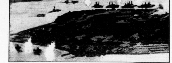
Bilddokument von der Vernichtung der USA-Pazifik-Flotte auf Pearl Harbour. Die uns als Funkbild übermittelte Luftaufnahme ist von einem japanischen Flieger am 8. Dezember 1941 morgens während des Angriffs der Bombenschwader von einem Flugzeug aus gemacht worden. Das Bild zeigt die Einschläge der Bomben bei diesem schrecklichen japanischen Fliegerangriff, bei dem zahlreiche Schiffe der amerikanischen Pazifik-Flotte vernichtet oder versenkt wurden.

In Rotterdam wurde kürzlich Europas größter Unterwasserkanal, der unter dem Namen Indusdijk bekannt ist, eingeweiht. In Rotterdam wurde kürzlich Europas größter Unterwasserkanal, der unter dem Namen Indusdijk bekannt ist, eingeweiht.