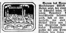
Das Schloß Merseburg in Merseburg...