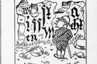
Die scheinmässigen Buchstaben, richtig gelesen, ergeben einen Schlußwort.