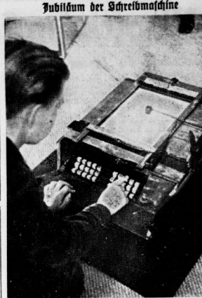
Tubulum der Schreibmaschine