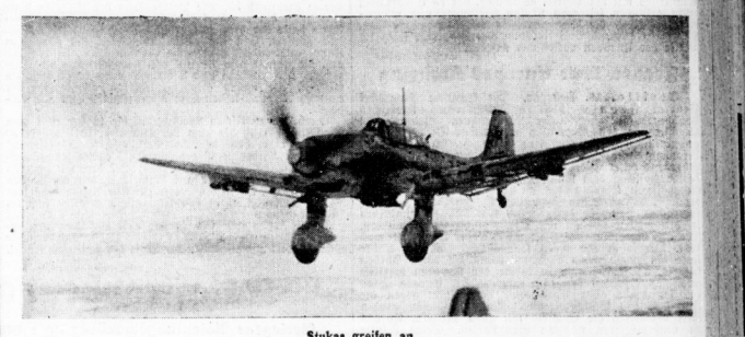
Im geschlossenen Verband fliegen Sturzkampfflugzeuge ihrem Einsatzziel zu

Berlin, 16. Februar. Einen neuen großen Erfolg errangen deutsche U-Boote und Flugzeuge gestern im Mittelmeer. Ein Geleitzug nördlich von Bengasi auf dem Weg zwischen Alexandria und Malta wurde von sechs britische Geleitzügen mit vierzehn Zerstörern und vierzehn U-Booten angegriffen. Die ersten Schiffe des Geleitzuges wurden durch die britischen U-Boote versenkt. Die vier großen Frachter wurden durch die Luftangriffe schwer beschädigt. Die britischen Geleitzüge wurden durch die deutschen U-Boote versenkt. Die vier großen Frachter wurden durch die Luftangriffe schwer beschädigt.