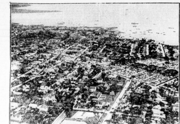
Deutsches U-Boot versenkte auf der Reede von Port of Spain zwei feindliche Schiffe

„Ich habe mich nicht getraut, Sie zu fragen.“ Er trug eine dicke Mütze und hatte die Hände in den Taschen. Er trug eine dicke Mütze und hatte die Hände in den Taschen.