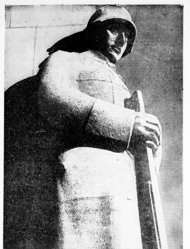
Heldengedenktag 1942