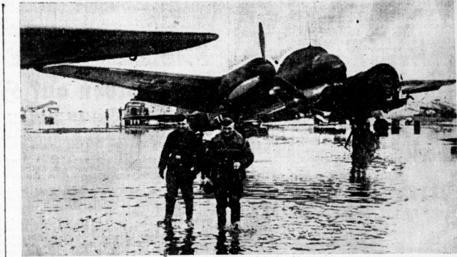
Am Morgen stand der Flugplatz einer Ju-88-Kommando in südlichen Abschnitt der Ostfront aus, als die Schneeschmelze begonnen hatte. Kurz darauf konnten die deutschen Maschinen trotzdem wieder starten und ihre Bomben in Richtung Seawallon tragen.

Der U.S.-Anferverluste in der letzten Woche versenkt worden. Schon 73 Zanter vor U.S. versenkt.