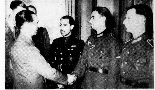
Europäische Studenten bei Reichsminister Dr. Goebbels. Reichsminister Dr. Goebbels empfing die an der Front mit den deutschen Kameraden kämpfenden europäischen Studenten, die gegenwärtig in Berlin ein Treffen veranstalten. Unser Bild zeigt die Begrüßung des spanischen Studentführers durch den Minister.

we. Rom, 15. April. (Genève Drahtbericht.) Der japanische Winterminister Nobuschi Kishi hat in der Vergangenheit immer wieder betont, dass sie die indische Bevölkerung nicht als Fremde, sondern als einen Teil der indischen Bevölkerung betrachtet.