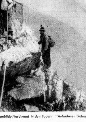
Partie an der Sonnblick-Nordwand in den Tauern

feinen Bunde wird er durch die Bunde... (Text continues with a personal narrative or commentary on the youth activities, mentioning various experiences and challenges faced by the young people in the mountains.)