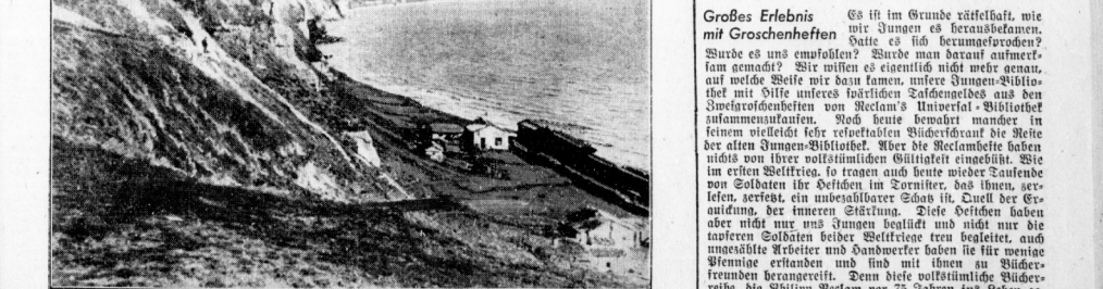
Steilküste von Kersch im Asowschen Meer ... Die Durchbruchschlacht auf der Landenge von Kersch ist die wertvollste Wehrmachtserfolge in der Ostfront.

20 Minuten „konzentrierter Haß“ im Mandbergelände ... Sch. Villingen, 14. Mai. (Gegner Transmitter). Die britische Wehrmacht hat in der Ostfront einen vollen Erfolg erringen. Die britische Wehrmacht hat sich über einen weiten Bereich der Ostfront erstreckt und hat die sowjetischen Truppen in die Defensive gedrängt.