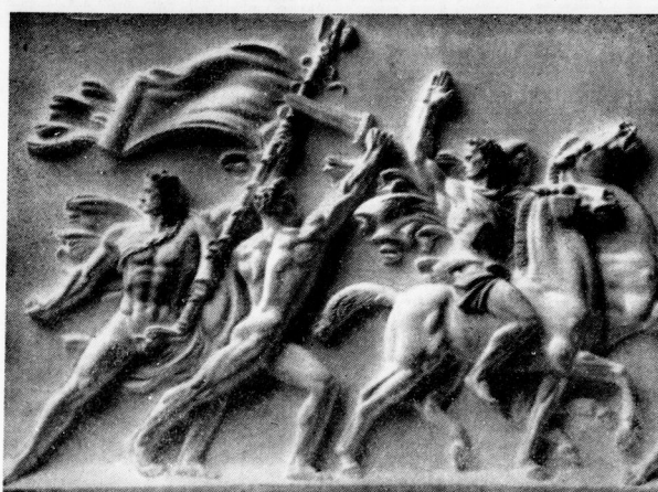
Auszug zum Kampf Relief von Arno Breker