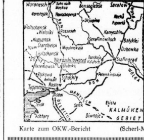
Karte zum OKW-Bericht (Scherl-M.)