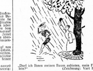
„Darf ich Ihnen meinen Baum anbieten, mein Fräulein?“ (Zeichnung: Vart Hen)

Heitere Momentaufnahmen Die heitere Momentaufnahmen sind eine Sammlung von lustigen Geschichten. Die heitere Momentaufnahmen sind eine Sammlung von lustigen Geschichten. Die heitere Momentaufnahmen sind eine Sammlung von lustigen Geschichten.