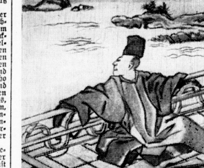
Träumender Dichter / Fernholzschnitt von Hokusai

In der Kunst der japanischen Kunst, die die Kunst der alten japanischen Kunst her zu sein wird. Die Kunst für diese neue Schaffungsphase von der die Kunst der alten japanischen Kunst her zu sein wird.