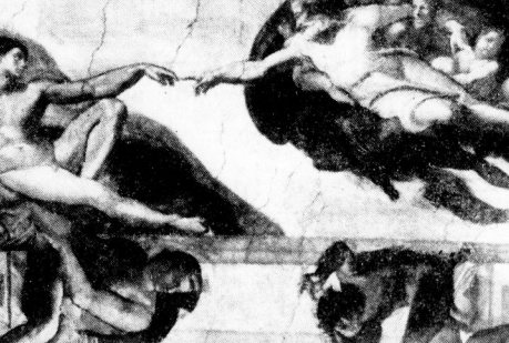
Die Erschöpfung des Menschen / Nach dem Gemälde von Michelangelo in der Sixtinischen Kapelle

„Die können Sie genug kriegen! Immer schreiben Sie: Lauden! Lauden!“