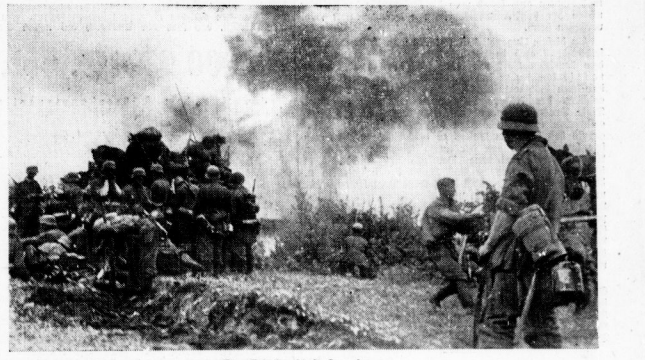
Der Feind schießt Sperrfeuer. Es ist am Morgen eines Angriffsstages. Deutsche Infanterie steht mit Sturmgeschützen zum Angriff bereit, während der Feind Sperrfeuer schießt.

B. Berlin, 1. August. (Ein Drahtbericht.) Die deutsche Wehrmacht hat in England einen Vormarsch erzielt. Die deutschen Soldaten haben eine glänzende Leistung erbracht.