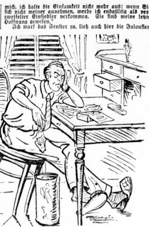
Ich stellte fest, daß die meisten Briefe gänzlich unwichtig waren