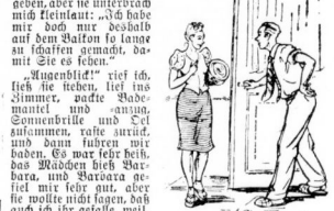
Ich habe schon auf Sie gewartet ... (Zeichn. Hei)