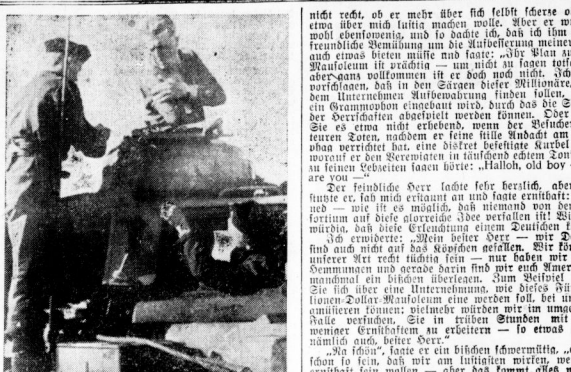
Ein Streifenhaub wird verbunden. Bei einem erfolgreichen Gegenstoß im mittleren Abschnitt der Ostfront war der Panzerführer leicht verletzt worden...