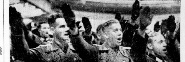
Der Führer sprach am Montag auf einem Appell im Berliner Sportplatz ...