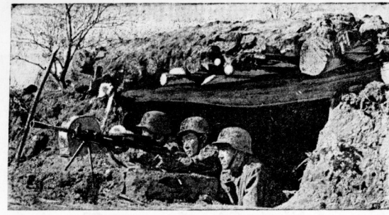
Turkistanische Freiwillige in einer Bankensitzung