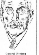
General Herzog. General Herzog. General Herzog. General Herzog. General Herzog.

Ein Burenleben. Ein Burenleben. Ein Burenleben. Ein Burenleben. Ein Burenleben.