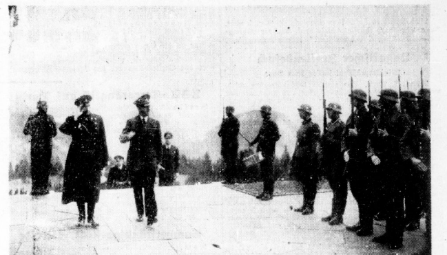
King Boris vom Führer empfangen Wie berichtet, empfing der Führer in Anwesenheit des Reichsaussenministers von Ribbentrop König Boris von Bulgarien und hatte mit ihm eine lange und herzliche Aussprache.

Der Führer hat die Winteroffensive als ein großer Erfolg betrachtet. Die Sowjetunion hat in der Winteroffensive 1,5 Millionen Menschen und 100.000 Geschütze verloren. Die Deutschen haben 1,2 Millionen Menschen und 100.000 Geschütze verloren. Die Sowjetunion hat in der Winteroffensive 1,5 Millionen Menschen und 100.000 Geschütze verloren. Die Deutschen haben 1,2 Millionen Menschen und 100.000 Geschütze verloren. Die Sowjetunion hat in der Winteroffensive 1,5 Millionen Menschen und 100.000 Geschütze verloren. Die Deutschen haben 1,2 Millionen Menschen und 100.000 Geschütze verloren.