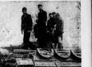
Auf, in unter dem Panzer — an diesem Wochenende öffneten sich ungezählte Möglichkeiten. (Aufnahmen: A. Giegold)

Darstellungen des Saunplatzes. Im großen Saal des Stadtschulhauses fand ein erwartungsvoller Empfang statt. Die Teilnehmer waren im Saal in Gruppen von 10 bis 20 Personen unterteilt. Die Teilnehmer waren im Saal in Gruppen von 10 bis 20 Personen unterteilt.