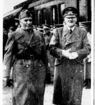
Begegnung Führer-Duce im Führer-Hauptquartier.

Gemeinsame totale Kriegsführung im Geiste der bewährten Waffentameradschaft