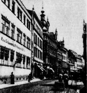
Die Nordseite der unteren Leipziger Straße mit dem Bankhaus Schaeffler. Das dahinter liegende Haus beherbergte eine Zeitung...