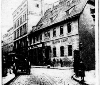
Auf der südlichen Seite des schmalen Straßenzuges stand das Gasthaus „Zum goldenen Löwen“...