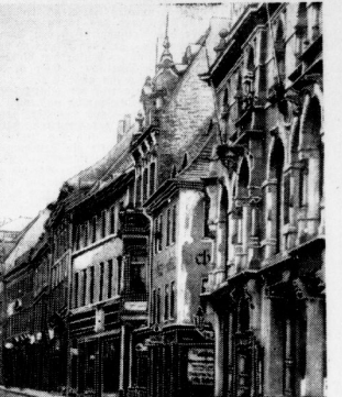
Das schöne alte Portal des Hauses Nr. 82