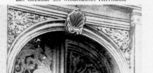
Das schöne alte Portal des Hauses Nr. 82