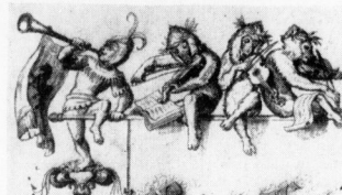
Titelblatt der Ausgabe mit den Illustrationen von Wilhelm von Kaulbach