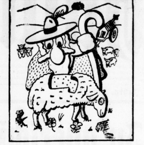
„Nein, welche Zeit! Da hat sich doch einer ein Pullover rausgeschritten!“ — Eine Karikatur aus „La terre française“...