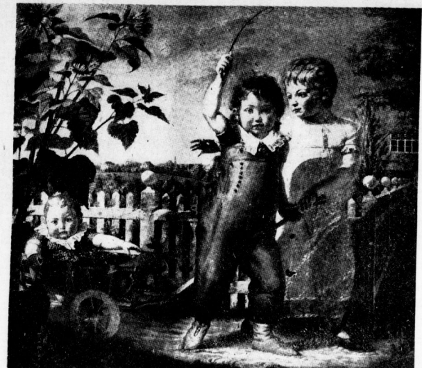
Philipp Otto Runge: Die Hülsenbecken Kinder