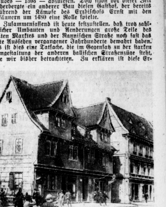
So sah die Mündung der Rannischen Straße in den Frankplatz um 1890 aus.