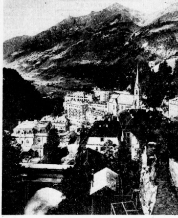
Blick auf Bad Gasteln