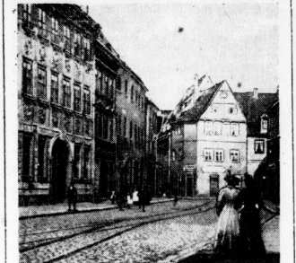
Blick in die Rannische Straße gen Norden. Das vordringende Haus Nr. 2 verengte damals die Zufahrt zum Alten Markt.