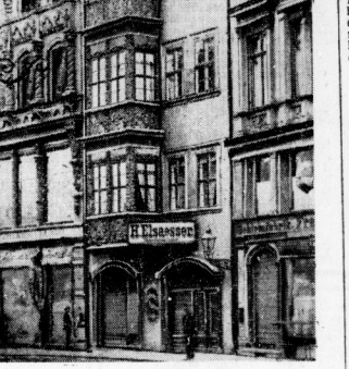
Die Zufahrt zur Gr. Ulrichstraße ist noch durch ein Goldschmieds Elsäcker (Kleinschmied Nr. 1) ist nach Abbruch des Gebäudes wandert der schöne (Aun.: Riehm, Stadthaus)