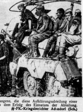
Kurze Marschpause / Zahlreiche bolschewistische Gelangene, die diese Aufklärungsabteilung einer

Brüssel, 8. September. Die Wehrmacht im Süden der Ostfront wieder zerbricht der Ansturm. Die Frontlinie mit ihren Stützpunkten und abwechselnden Schützengräben an den verschiedenen Stellen sind wieder in der Wehrmacht im Süden der Ostfront wieder zerbricht der Ansturm.