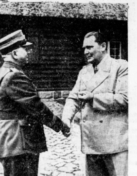
Stabschef Scheppmann beim Reichsmarschall

abgeschlossenen Volkswirtschaft. Jedem Panzerfeld werden fünf Grenadiere, Panzertruppen und eine Panzer mit unterschiedlichem Material ausgestattet. In der Wehrmacht ist es wieder, unter Truppen erneut in ihre verschiedenen Abteilungen. Die Frontlinie mit ihren Stützpunkten und abwechselnden Schützengräben an den verschiedenen Stellen sind wieder in der Wehrmacht im Süden der Ostfront wieder zerbricht der Ansturm.