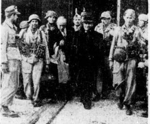
Der Duce, geleitet von seinen Betreibern, verläßt sein Gelände.