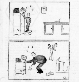
Zeichnung: Edmund Giesl