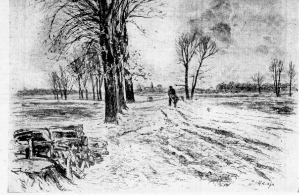
Zeichnung: G. Heib

Weit wandte er im Spätherbst überland. Es hat geregnet, graue Wolken gleiten Und treiben vor dem Winde. Bis zum Rand Des blauen Himmels zieht nach allen Seiten Schwarzaker oder letzter Früchte Feld Und wühlt und dehnt sich und erfüllt die Weiten, Fern ruht ein Dorf, ein dunkles Waldstück hält Und ragt am Horizont, rings wölbt sich nur Das Heimatländ. Kein Menschenhül erstellt Sein herblich Warten, stille liegt die Flur.