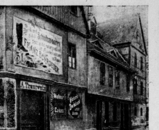
So sah die Mündung der Kleine Ulrichstraße in die Große Ulrichstraße im Jahr 1935 aus. Heute verbindet sich hier an der Ecke links das Geschäft von Fisch-Reuter.

Das Solltämliches Konzert ist ein wichtiges Ereignis. Das Solltämliches Konzert ist ein wichtiges Ereignis. Das Solltämliches Konzert ist ein wichtiges Ereignis.