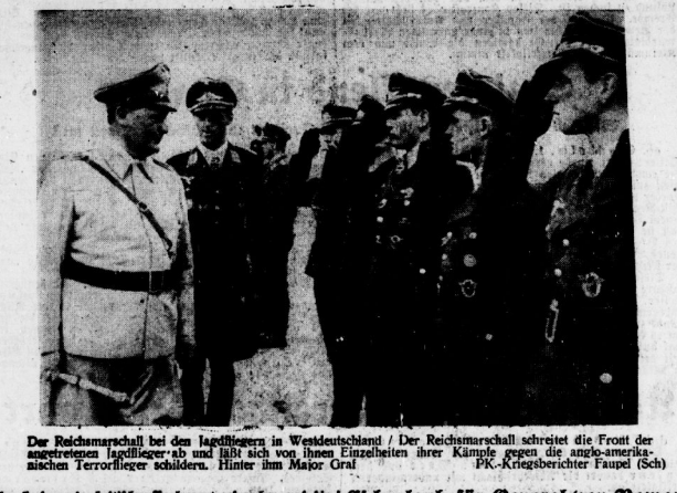
Der Reichmarschall bei den Jagdritten in Westdeutschland. Der Reichmarschall schreibt die Front der angetretenen Jagdritter ab und läßt sich von ihnen Einzelheiten ihrer Kämpfe gegen die angriffslustigen Terrorflieger schildern. Hinter ihm Major Graf RK-Kriegsberichterstatter Faupel (Sch)

In. Stockholm, 1. November. Die Lage in Indien wird trotz aller beschriebenen Enttäuschungen des englischen Reiches nicht besser. Die Hungersnot in Indien wird eine Katastrophe sein. Das Parlament hat heute eine Resolution angenommen, die die britische Regierung zu einer bestimmten Unterstützung mit Nahrungsmitteln auffordert. Die britische Regierung hat sich bisher weigert, die britische Regierung zu unterstützen. Die Hungersnot in Indien wird eine Katastrophe sein.