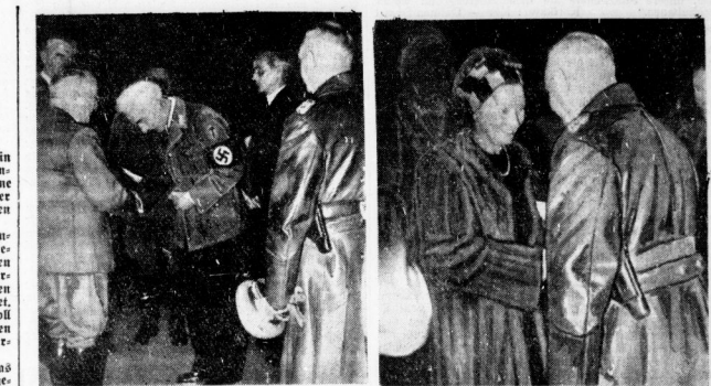
Zum zehnjährigen Bestehen der NS. Gemeinschaft „Kraft durch Freude“ gegründet wurde, fand am Sonntag in der Reichshauptstadt ein Festakt statt. — Unser Bild zeigt links: Reichsorganisationsleiter Dr. Ley überreicht im Auftrag des Führers Künstlern und Künstlerinnen die Mitgliedsurkunde der Reichsgemeinschaft „Kraft durch Freude“.