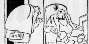
Das Jahr 1943: Ich weiß, Sie haben Großes von mir erwartet. Aber ich fürchte, daß wie ich so auch mein Nachfolger Sie enttäuschen wird.