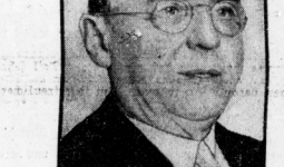
Der Bürgermeister von Chicago, Cermat, kurz vor dem Attentat.

Die Folgen des Attentats von Miami sind nunmehr bekannt. Der Bürgermeister von Chicago, Cermat, der am 4. März 1932 in Miami (Florida) am 15. Februar schwer verletzt worden war, ist am 6. März 1933 gestorben. Er starb an den Folgen eines Schädeltraumas, das er durch einen Schuss erlitten hatte. Der Mörder des Bürgermeisters ist noch nicht identifiziert. Die Polizei sucht den Täter. Die Folgen des Attentats sind nunmehr bekannt. Der Bürgermeister von Chicago, Cermat, der am 4. März 1932 in Miami (Florida) am 15. Februar schwer verletzt worden war, ist am 6. März 1933 gestorben. Er starb an den Folgen eines Schädeltraumas, das er durch einen Schuss erlitten hatte. Der Mörder des Bürgermeisters ist noch nicht identifiziert. Die Polizei sucht den Täter.