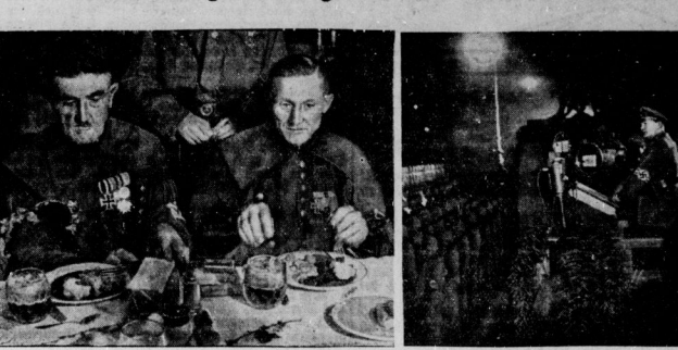
Links: So bewirkte Berlin seine Ehrenzüge, die Arbeiterabordnungen, die in Flugzeugen aus den verschiedenen Teilen des Reiches zu den Feiern nach Berlin gekommen waren. Rechts: Die mitternächtliche Kundgebung der unformierten Verbände im Lustgarten: Ministerpräsident Göring spricht.