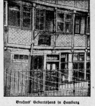
Brahm's Geburtshaus in Hamburg