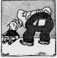
„Wie kommt das Muster in deinem Segel bog samant vor?“