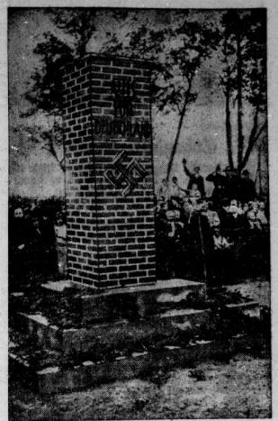
Das erste Denkmal der nationalen Erhebung. In Straßburg-Neudorf bei Elzach wurde das erste Denkmal zur Erinnerung an den 3. März 1933 errichtet...