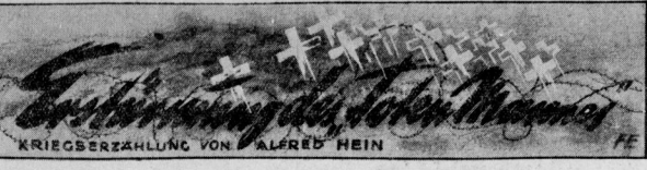
KRIEGSERZÄHLUNG VON ALFRED HEIN