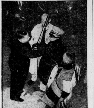
Der Menjur: Die „Leber“ werden geprüft