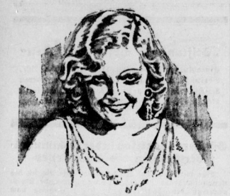
Ein Weib aus der Dölbe

Die Innungs-Krankentassen sind die Grundlage der Sozialversicherung für die Arbeiter. Sie müssen sich der Aufgabe widmen, den Aufbau des neuen Deutschlands zu beschleunigen.