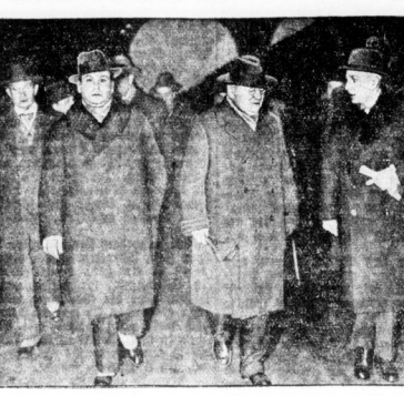
Die Ankunft des russischen Außenkommissars Litwinow in der Reichshauptstadt.